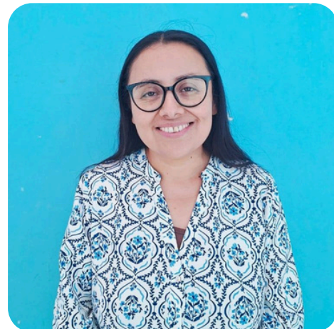
Lengua y literatura